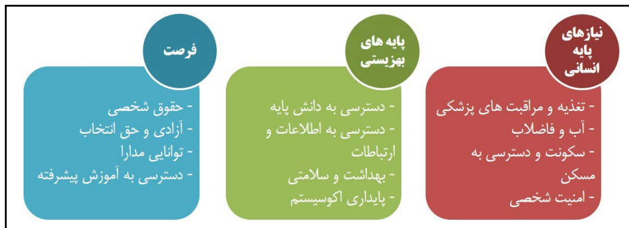
شکل ۱: اهداف و شاخص‌های پیشرفت اجتماعی (Porter et al., 2014: 28)

اقتصادی ایالات متحده آمریکا، ۲۰۰۱). «کانتی ری» (۲۰۰۸) متغیرهای توسعه اجتماعی را شامل: امید به زندگی در بدو تولد، درصد باسواد بزرگسالان ۱۵ سال به بالا، نسبت ثبت‌نام خالص ترکیب دبستان، متوسطه و آموزش عالی، نرخ بقای نوزادان در هر ۱۰۰۰ تولد زنده، سرانه تأمین کالری روزانه، خطوط تلفن اصلی برای هر ۱۰۰۰ نفر، پزشک به ازای هر ۱۰۰۰۰ نفر و سرانه مصرف برق می‌داند (کانتی‌ری، ۲۰۰۸: ۱۷)؛ هم‌چنین «پورتر» و همکاران (۲۰۱۴) در راستای ارائه شاخص پیشرفت اجتماعی، از سه هدف پایه و زیرشاخص‌ها و متغیرهای این سه هدف، بهره برده‌اند (شکل ۱).