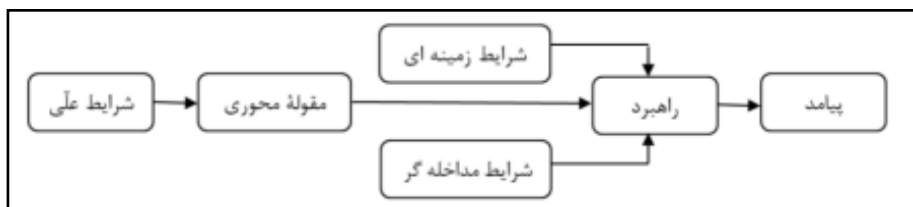
جدول ۱: مدل مورد استفاده پژوهش (نگارندگان، ۱۴۰۰).