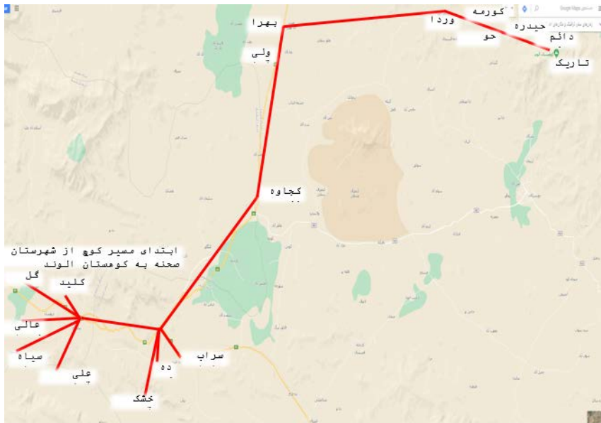
نقشه ۳. مسیر کوچ نیمه یکجانشینان ایل ترکاشوند از شهرستان صحنه به کوهستان الوند.