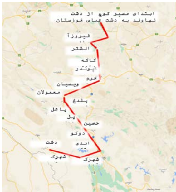
نقشه ۱. مسیر کوچ ایل ترکاشوند از دشت نهاوند (فیروزان) به دشت عباس خوزستان

مسیر دوم: کوهستان الوند - اسدآباد - بهراز - گردنه بیدسرخ - شتزل و کوتاه‌دره - تنگ گاه‌شمار الشتر - رومشگان - طویل‌کش - پلدختر - چل - پل‌گاو میشان - آبدانان - گچ‌زاخ - دشت عباس. فاصله الوند تا دشت عباس به دلیل وجود ایل‌راه‌ها دقیقاً مشخص نیست، ولی با توجه به فواصل خطی نقطه به نقطه حدود ۸۵۰ کیلومتر است. مسیر سوم: کوهستان الوند - بهراز - کجاوه‌شکن - روستای کارخانه - بیدسرخ - دشت چمچمال - بیستون - تنگ برناج - قره‌سو - شش‌بهمن کرمانشاه - ماهیدشت - شاه‌آباد - سراب سنگان - ایلام - دیره - پشته‌آمام حسن (نقشه ۲). فاصله این دو منطقه به دلیل وجود ایل‌راه‌ها دقیقاً مشخص نیست، ولی با توجه به فواصل خطی نقطه به نقطه حدود ۴۰۰ کیلومتر است.