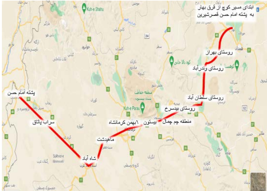
نقشه ۲. مسیر کوچ ایل ترکاشوند از قرق بهار تا پشته امام حسن قصرشیرین پیش از سال ۱۳۳۲ ه.ش.