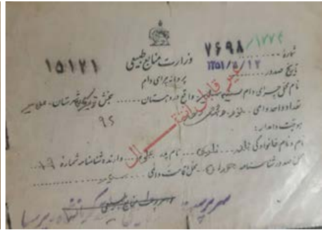
تصویر ۱. سند واگذاری مرتع به طایفه گرگه