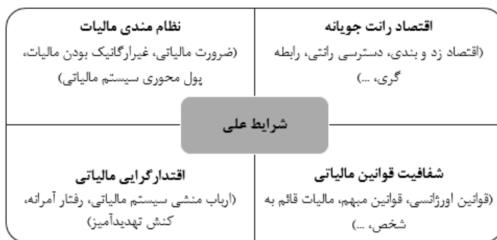
شکل ۱: شرایط علی - مقوله‌های اصلی و فرعی

کنش تهدیدآمیز سیستم مالیاتی با مؤدیان، دیگر مقوله فرعی مرتبط با مقوله اقتدارگرایی مالیاتی است، براساس تفسیر افراد مورد مطالعه سیستم مالیاتی پروتکلی خشن را برای تشخیص و وصول مالیات تدوین کرده است، وضعیت پاسخگویی به مؤدیان چندان مطلوب نیست، ممیزان مالیاتی نقش داروغه را بازی می‌کنند، نگاهی مجرم‌گونه به مؤدیان دارند و کنش آن‌ها با مؤدیان مبتنی بر تهدید و ارعاب است. یکی از مشارکت‌کنندگان چنین بیان می‌کند: «وقتی شما می‌روید اداره مالیات انگار مجرم هستید رفتید اونجا، همان احساسی را فرد دارد که می‌رود پاسگاه پلیس، فضای اداره مالیات چنین فضایی را برای شما ترسیم می‌کند، یک فضای خشک و غیرمنعطف و کارمندانی که با اخمای گره کرده به شما نگاه می‌کنند».