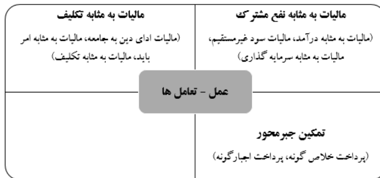
شکل ۴: راهبردها (عمل - تعامل‌ها) - مقوله‌های اصلی و فرعی

نوع دیگر کنش مالیاتی پرداخت اجبارگونه یا مبتنی بر اجبار است، به این معنا که آنها ناچارند اقدام به پرداخت مالیات تشخیصی از طرف سیستم مالیاتی نمایند، حتی اگر فعالیت اقتصادی آنها مشمول نرخ مالیاتی تعیین شده از طرف سیستم نباشد، زیرا سیاست‌های تنبیهی سیستم در روند فعالیت اقتصادی آنها وقفه‌های جدی و تأثیرگذار ایجاد می‌کند. مشارکت‌کننده‌ای پرداخت اجبارگونه مالیات را این‌گونه توصیف می‌کند: « مالیات پول ناحقی است که از ما می‌گیرند، اگر در شرایطی قرار بگیریم که بتونم پرداخت نکنم، نمی‌کنم، برای چی پرداخت کنم، الآن دارم به زور پرداخت می‌کنم برای اینکه نمی‌ذاره کار بکنم ».