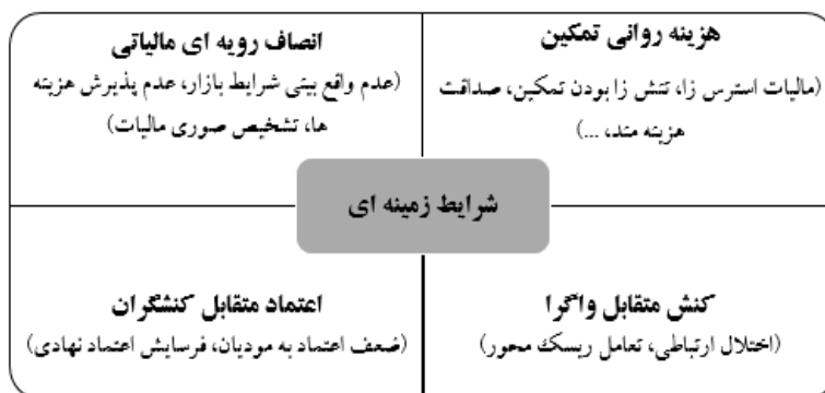
شکل ۲: شرایط زمینه‌ای - مقوله‌های اصلی و فرعی

کنشگران سیستم مالیاتی نیز نوعی نگاه بدبینانه و مبتنی بر عدم صداقت به مؤدیان دارند، از نظر آن‌ها مؤدیان مالیاتی در گزارش فعالیت اقتصادی و میزان درآمد خود شفافیت لازم را ندارند و از هر فرصت و ابزاری برای تعدیل مالیات و اجتناب از پرداخت آن استفاده می‌کنند. مشارکت‌کننده‌ای می‌گوید: «داره دارایی همه چیز را براساس عدم اعتماد می‌گذارد، چون براساس عدم اعتماد می‌گذارد، همیشه شما را دزد و دنبال فرار از مالیات می‌بیند، کاری هم به سوابق شما ندارد، این فرهنگ دارایی است، به خاطر اون آدم‌هایی که فرار کردند، کلک زدند، مسئله ایجاد کردند و خیلی از همکارهای من هم این کار را کردند و می‌کنند».