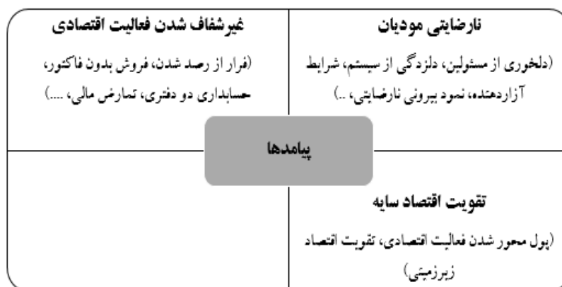
شکل ۵: پیامدها - مقوله‌های اصلی و فرعی