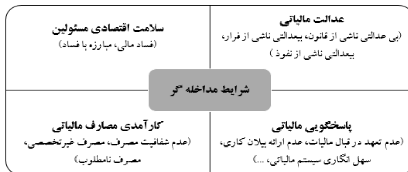
شکل ۳: شرایط مداخله‌گر - مقوله‌های اصلی و فرعی

برونداد درآمدهای مالیاتی در جامعه مطلوب نیست. خدمات ارائه‌شده از طرف دولت متناسب با مالیاتی که دریافت می‌کند نیست و مالیات اثربخشی ضعیف و نامطلوبی برای بهبود مسائل جامعه دارد. افراد مورد مطالعه بر این باورند که درآمدهای مالیاتی به صورت نامطلوب هزینه می‌شود. هزینه‌کرد مالیات عام‌المنفعه نیست و به صورت نابجا در راستای منافع افراد و گروه‌های خاص هزینه می‌شود. مشارکت‌کننده‌ای این‌گونه نقل می‌کند: «مالیات‌ها پرداخت می‌شود، یکجا جمع می‌شود ولی بهینه مصرف نمی‌شود، اتلاف پول است یعنی پولی که ما دادیم جایی صرف شده که صحیح مدیریت نشده، بهینه‌سازی نبوده به جای اینکه این پول جای درستی خرج بشه، جایی خرج شده که اثر مطلوبی در جامعه ندارد».