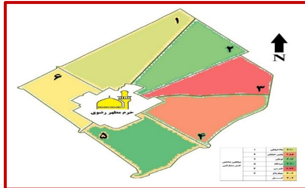
شکل ۳: نقشه توصیفی شاخص کنش مشارکتی در نوسازی بافت فرسوده در محلات منطقه ثامن