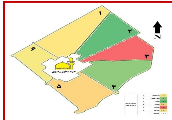
شکل ۱: نقشه توصیفی شاخص سرمایه فرهنگی در محلات منطقه ثامن

۵-۱-۵. نقشه‌های توصیفی سرمایه فرهنگی، سرمایه اجتماعی و کنش مشارکتی با توجه به شکل زیر محله طبرسی کمترین میانگین را در سرمایه فرهنگی و محله نوغان بیشترین مقدار را دارا می‌باشد.