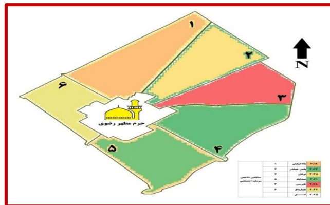
شکل ۲: نقشه توصیفی شاخص سرمایه اجتماعی در محلات منطقه ثامن

با توجه به این شکل محله طبرسی کمترین میانگین را در سرمایه اجتماعی و محله پایین خیابان بیشترین مقدار را دارا می‌باشد.