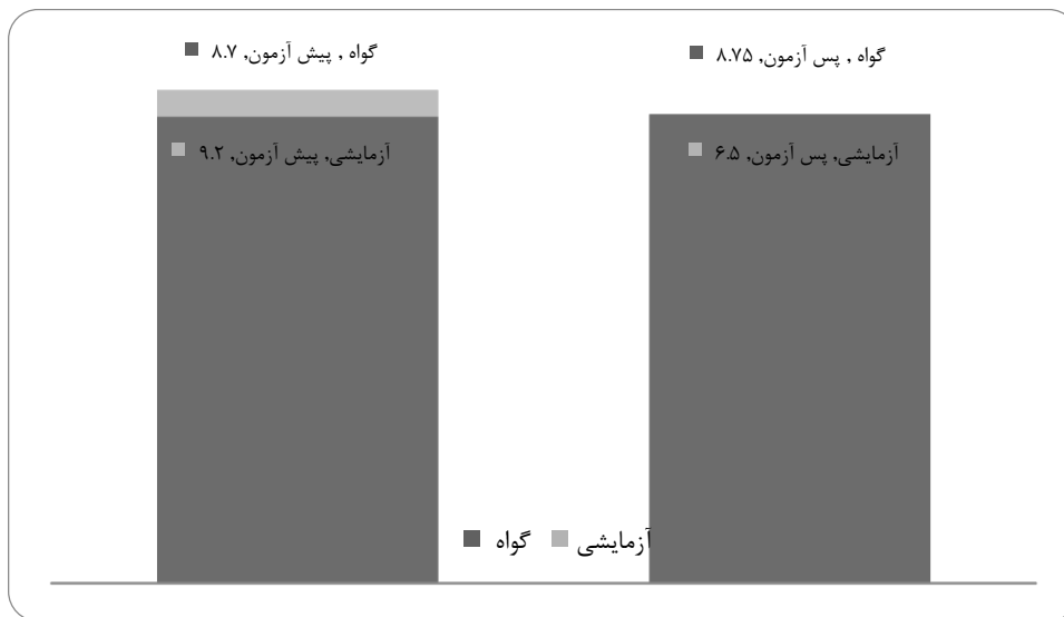
نمودار ۳: نمودار میانگین در آزمون پرخاشگری TA

میانگین پس‌آزمون نسبت به پیش‌آزمون در گروه آزمایشی کاهش یافته است که شاید بتوان آن را ناشی از تأثیر قصه درمانی به روش TA دانست. میانگین نمره آزمودنی‌ها در گروه‌های پژوهشی (آزمایشی و گواه) در دو نوبت اجرا (پیش‌آزمون و پس‌آزمون) در مقایسه با یکدیگر در نمودار ۳-۱ نشان داده شده است.