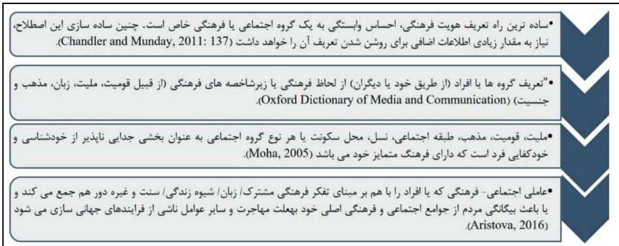
شکل ۱: دسته‌بندی تعاریف هویت فرهنگی (قاسمی، ۱۴۰۰)