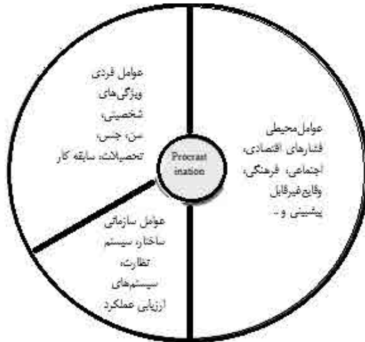
شکل ۱: عوامل مؤثر بر اهمال‌کاری تحصیلی (نگارندگان، ۱۴۰۲).