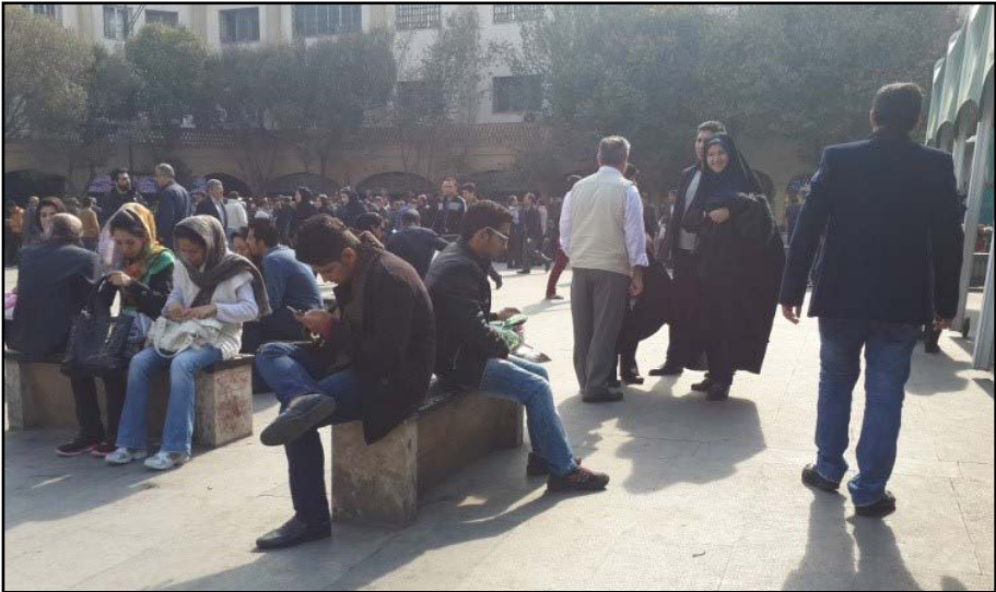
تصویر ۳: حضور مردم در سبزه میدان

احتمالی و یا فرضیه‌هایی که بر مبنای داده‌های اولیه ساخته و پرداخته شده، آزمون می‌شوند و یا ارتباط بعضی یافته‌ها تا آن مرحله از کار با بعضی نظریه‌های رایج و امثال آن‌ها یادداشت می‌شود (محمدی، ۱۳۹۰). در اینجا نیز همین کار صورت گرفت و علاوه بر مصاحبه با دلارفروشان و مردم، یادداشت‌های نظری در میدان تحقیق جمع‌آوری شد، و سپس دسته‌بندی شدند و از میان آن‌ها رمزهایی استخراج شدند.