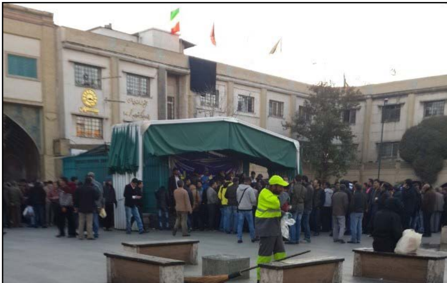
تصویر ۲: تجمع دلار فروشان