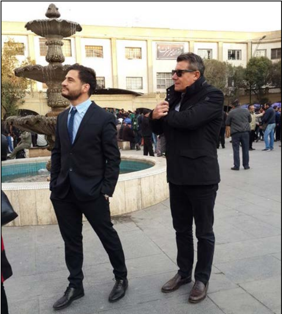
تصویر ۱: حضور گردشگران خارجی در سبزه میدان

در این یادداشت‌ها، مطالب نظری از قبیل تجزیه و تحلیل‌های اولیه، فرضیه‌های