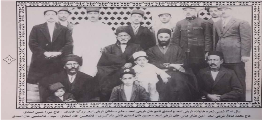
عکس ۲. سال ۱۳۰۵ ه.ش. کشمیری (۱۳۸۹).