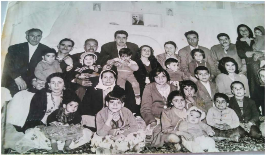
عکس شماره ۴، سال ۱۳۳۹، آرشیو عکس‌های خانوادگی فرید مرندی (عکاسی مهتاب)

زمینه پوشش افراد می‌توان گفت که در عکس‌هایی که مربوط به سال‌های نخست پهلوی اول و دوم در میان افراد مسن و سال خورده، در برابر کشف حجاب و تغییرات پوششی مقاومت نشان داده‌اند. کشف حجاب در دوره پهلوی اول (۱۳۱۴) و یک‌شکلی لباس‌ها، تغییر در کلاه مقوایی، جایگزین شدن کلاه پهلوی و سپس کلاه شاپو، استفاده از پیراهن‌های یقه‌دار در عوض پیراهن یقه‌گرد، استفاده از کفش چرم و درنهایت، استفاده از کلاه پهلوی، کت و دامن در میان زنان و برداشته شدن پوشش‌های قاجاری، در عکس‌ها نمایان است. دیگر این‌که، کالاهای خارجی مورد مصرف افراد قرار گرفته‌اند. در باب رمزگان سطح سوم و چهارم، یعنی نگاه و ژست افراد و فضاهای عکس‌برداری، تا اواخر دوره پهلوی، انعطافی در چهره و رفتار افراد دیده نشده است. عکس‌هایی که فضای داخلی خانه و محیط بیرون (پارک و...) گرفته شده‌اند، انعطاف در حالت رفتاری افراد را نشان می‌دهد. استفاده از مکان‌های عمومی، نشانه آشنایی مردم با عکاسی و حوزه عمومی، رواج یافتن آن در بین قشر عامه، هم‌چنین پیشرفت در دوربین‌های کوچک و فلاش‌دار را بازنمایی می‌کند. شکل‌گیری طبقه‌ی متوسط نیز در این دوره دیده می‌شود.