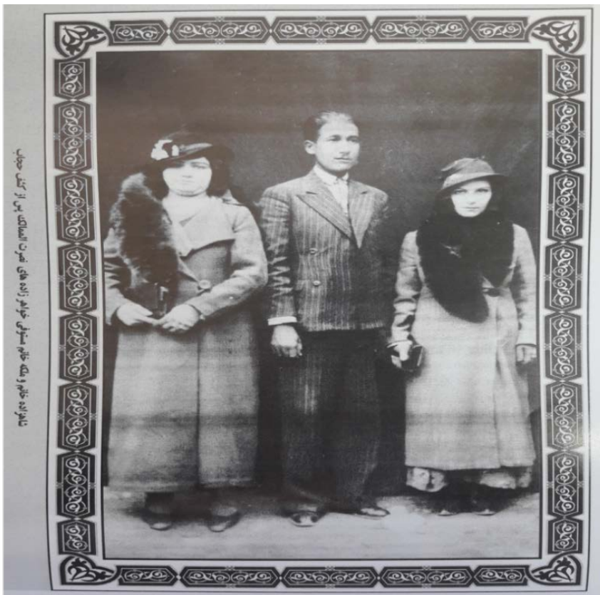
عکس ۳. سال ۱۳۲۰ ه.ش. کشمیری (۱۳۸۹).