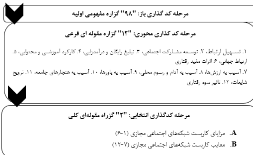
شکل ۲: فرایند مدیریت داده‌ها و تکامل مدل در سه مرحله کدگذاری باز و محوری و انتخابی

پس از انجام مصاحبه تا مرحله اشباع و استخراج مقولات، در نهایت ۹۸ مقوله مفهومی اولیه، ۱۲ مقوله فرعی و ۲ مقوله اصلی به دست آمد. جزئیات مقولات به دست آمده در اشکال شماره ۲ یعنی کدگذاری داده‌ها و شماره ۳ یعنی الگوی فایده‌مندی کاربست شبکه‌های اجتماعی مجازی و مقوله‌بندی‌ها در قالب جدول ۲، نشان داده شده است.