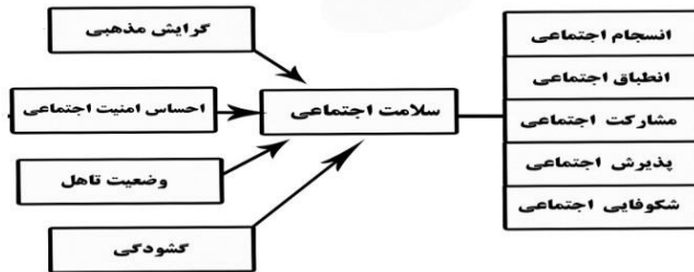
نمودار ۱: مدل مفهومی پژوهش